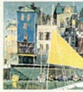
《노르망디의 항구(노란 돛)》 1985년

■개관시간/9시~18시(입관은 17시까지) ■입장료/현금 500엔, 패스포트·패스카드 소지자 200엔